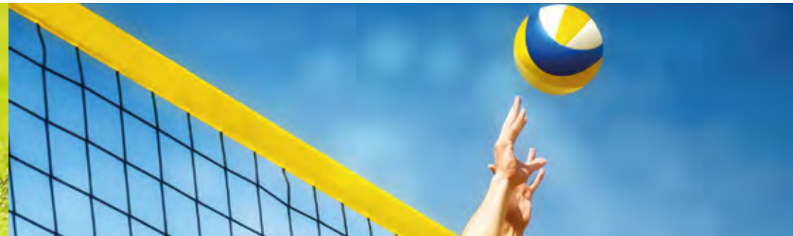
Espaço para Vôlei