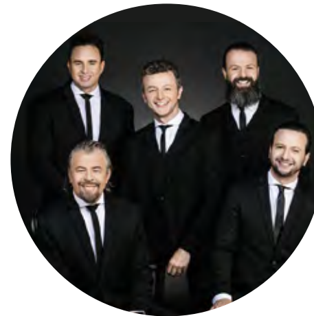
Família Lima - Músicos