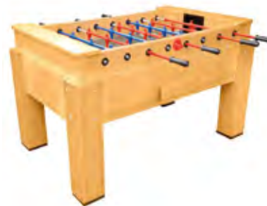
Mesa de Pebolim