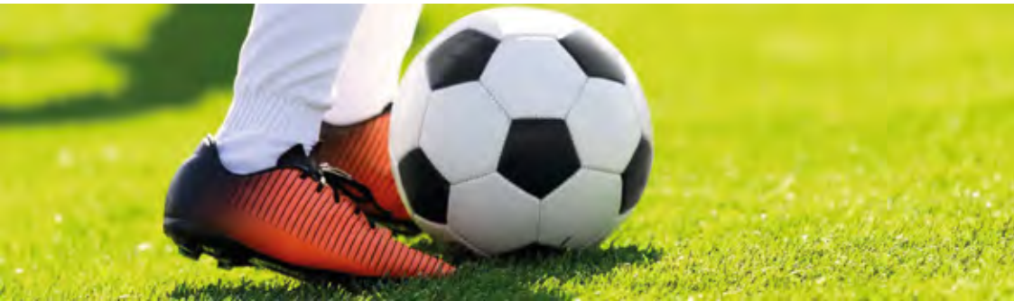
Espaço para Futebol