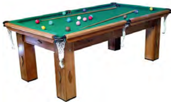
Mesa de Bilhar