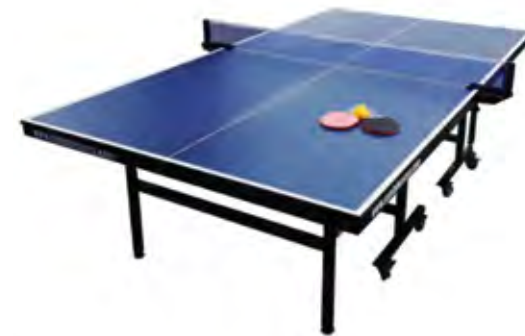
2 Mesas de Ping Pong