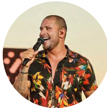
Diogo Nogueira - Cantor