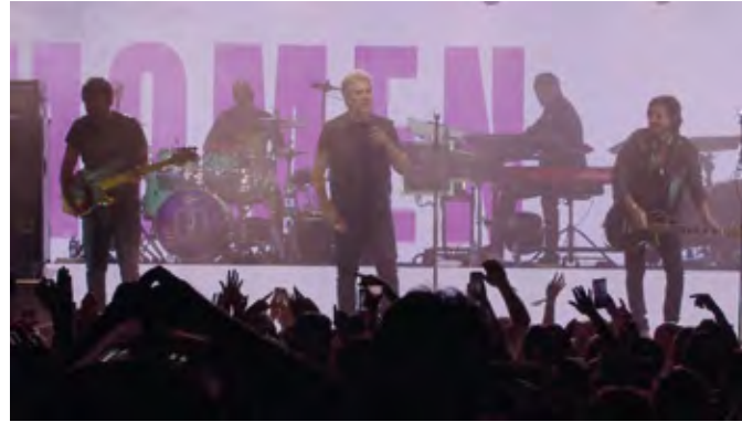
Jota Quest - Banda