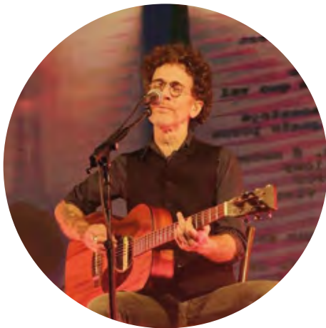
Nando Reis - Cantor